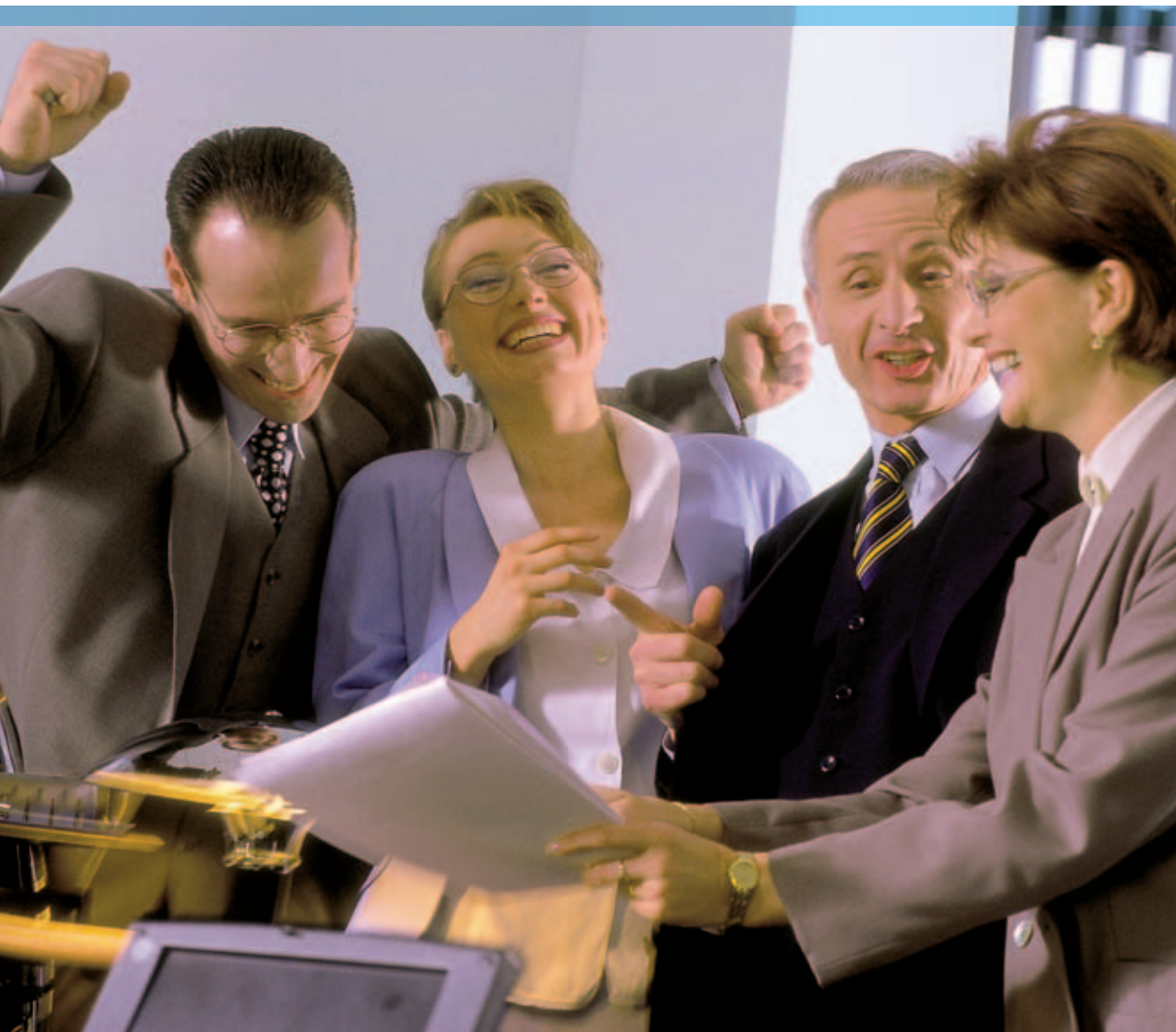
Bild: Gemeinsame Zielausrichtung ist einer der vier Erfolgsfaktoren.

halten gefüllt. Ein gemeinsames Verständnis über deren Bedeutung für die interne Zusammenarbeit und für das externe Auftreten wird gefunden und definiert. Die so genannten Handlungsfelder werden bestimmt.